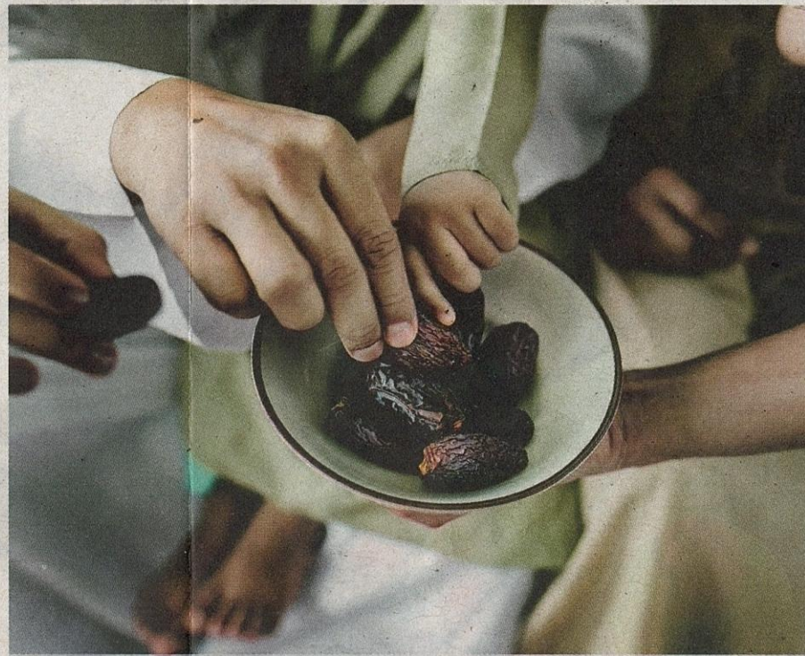
IBADAH puasa termasuk puasa sunat menjadi perisai kepada kita daripada api neraka.