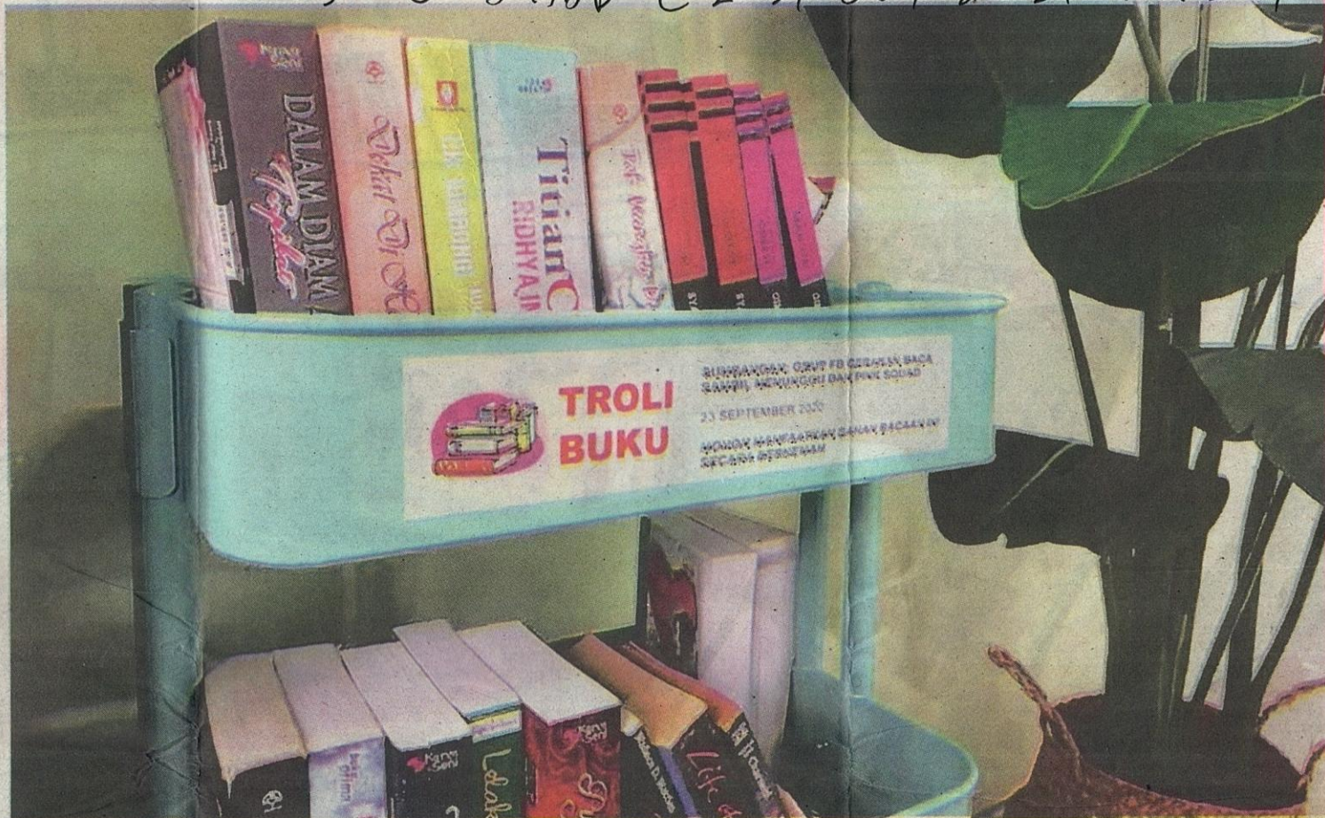
PADA troli ini tertampal pelekat Troli Buku yang disumbangkan oleh kumpulan Gerakan Baca Sambil Menunggu (GBSM) dan rakan kerjasama.