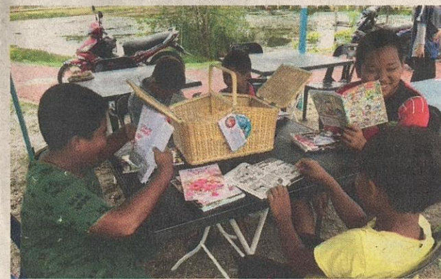
ANAK-anak penduduk kawasan perumahan KEDA, Teluk Berembang sedang asyik membaca komik dan buku yang berada dalam bakul.

inisiatif seperti ini, ia sekali gus dapat menyokong hasrat Kementerian Pengajian Tinggi untuk memasyarakatkan