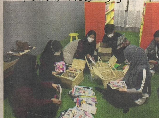
SUKARELAWAN UCTC UPSI memasukkan bahan bacaan dalam bakul buku untuk disumbangkan di kawasan sekitar tumpuan penduduk Pulau Tuba.