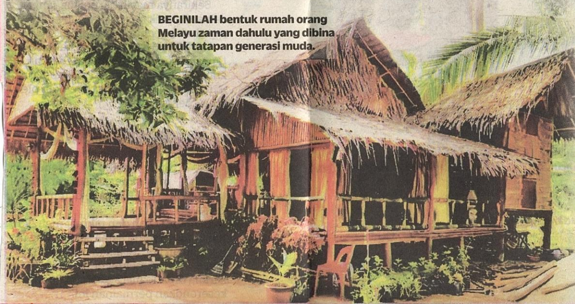
BEGINILAH bentuk rumah orang Melayu zaman dahulu yang dibina untuk tatapan generasi muda.

Sekiranya ingin menunggang kuda atau pun bergambar bersama haiwan berkenaan pengunjung dikenakan caj RM5.