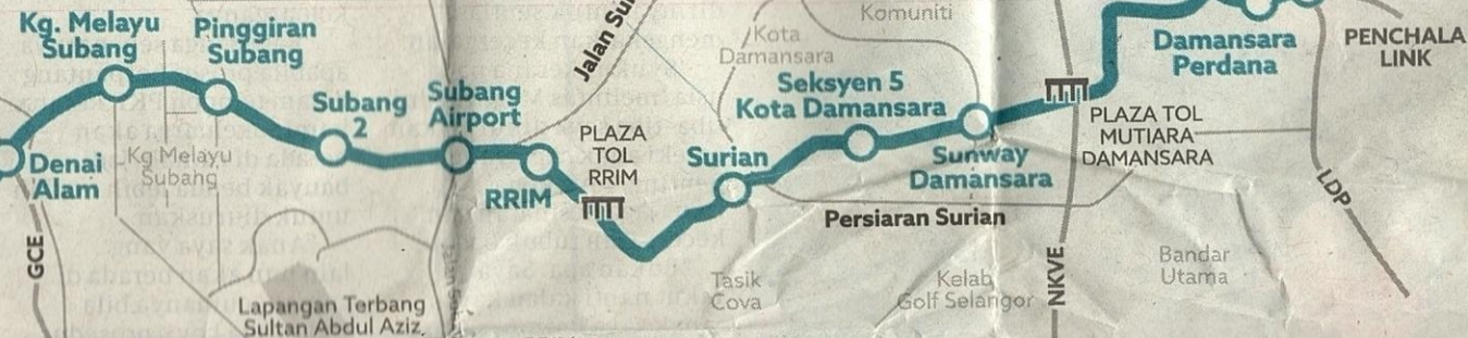
'Spaghetti Link' yang merentasi LDP di kawasan Penchala