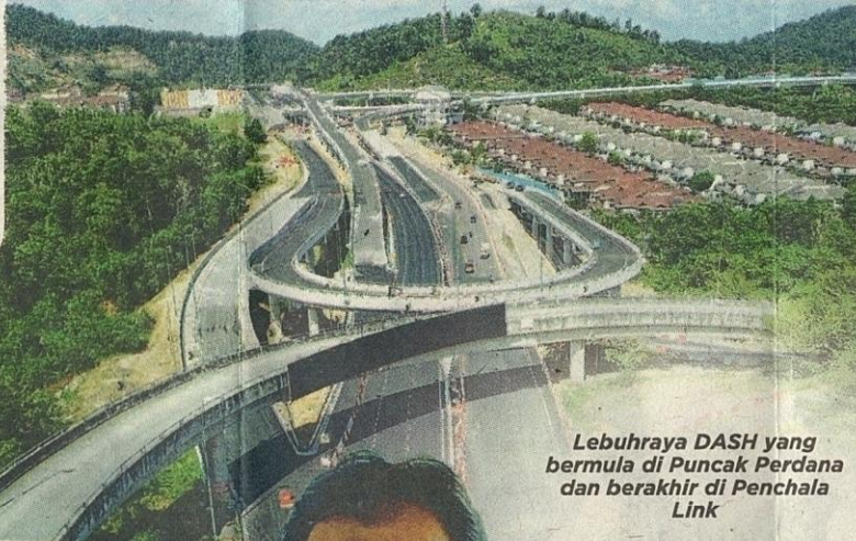
Lebuhraya DASH yang bermula di Puncak Perdana dan berakhir di Penchala Link