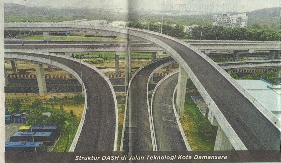
Struktur DASH di Jalan Teknologi Kota Damansara