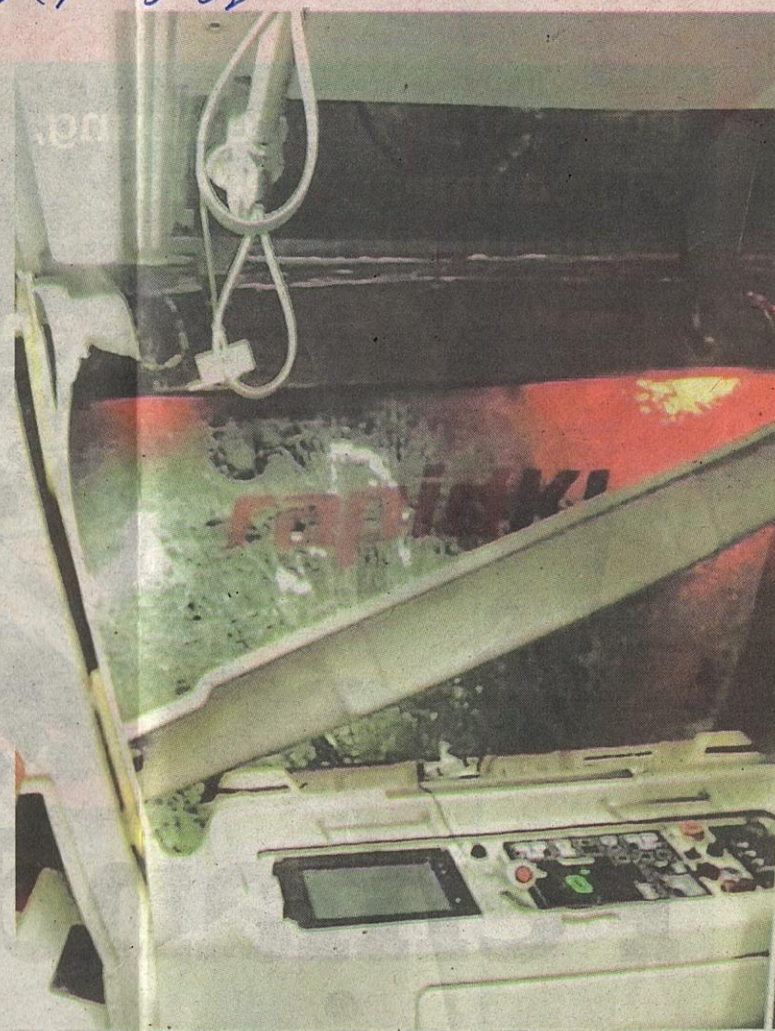
KEADAAN salah sebuah tren selepas bertembung.

hun 1996 telah mengakibatkan 64 daripada 213 penumpang Tr18 cedera dan dirawat di Hospital Kuala Lumpur.