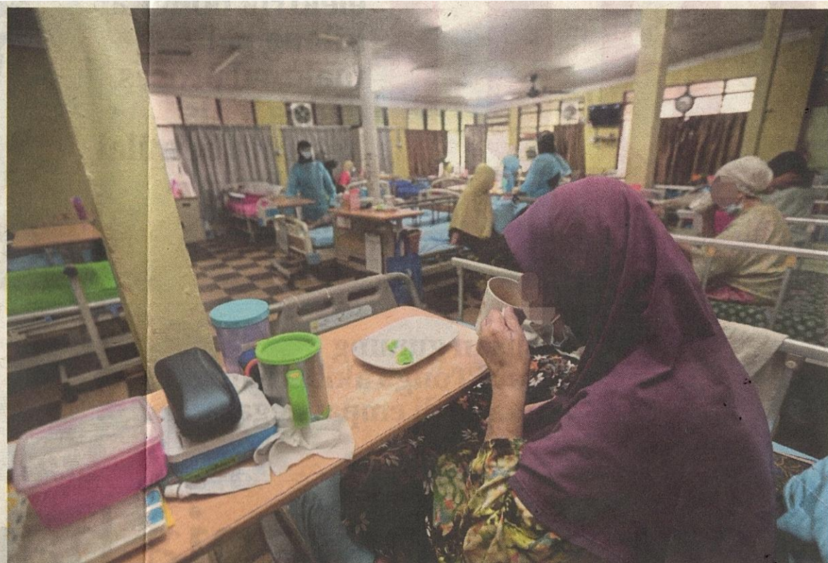
Antara kos paling tinggi ialah menyediakan lampin pakai buang untuk keperluan penghuni rumah warga emas. (Foto hiasan)

Khor berkata, pusat jagaan itu hanya menempatkan wanita berusia antara 68 hingga 94 tahun yang dimasukkan berdasarkan