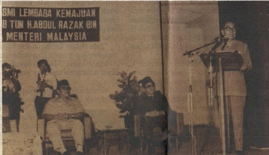
Perdana Menteri kedua, Allahyarham Tun Abdul Razak Hussein (kanan) berucap ketika perasmian penubuhan KADA pada 2 Mac 1973.

“KADA juga berfungsi menjaga kesejahteraan masyarakat tani di kawasan seliaan KADA sekali gus memperkembang dan memajukan sektor penanaman padi