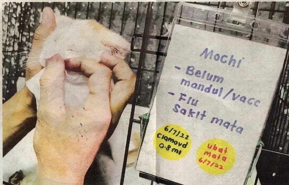
TERDAPAT label-label pada sangkar kucing berpenyakit yang memberi maklumat tentang masalah kucing berkenaan.