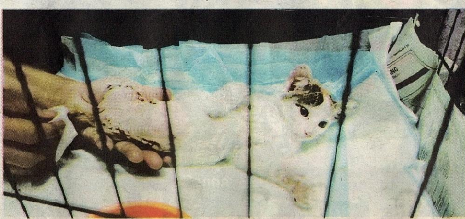
PARA pekerja menguruskan kucing-kucing dengan penuh kasih sayang.

“Di tingkat dua dan tiga pula, ia menjadi tempat tinggal kucing-kucing jalanan peliharaan kami yang sudah sihat, bebas daripada sebarang penyakit, sudah divaksin sepenuhnya dan sedia untuk diserahkan kepada penjaga baharu yang ingin memilikinya,” katanya.