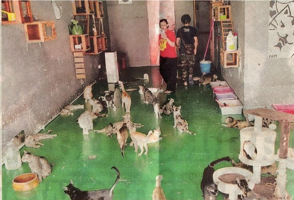
KUCING-KUCING yang telah sihat bebas bermain di ruangan yang disediakan.