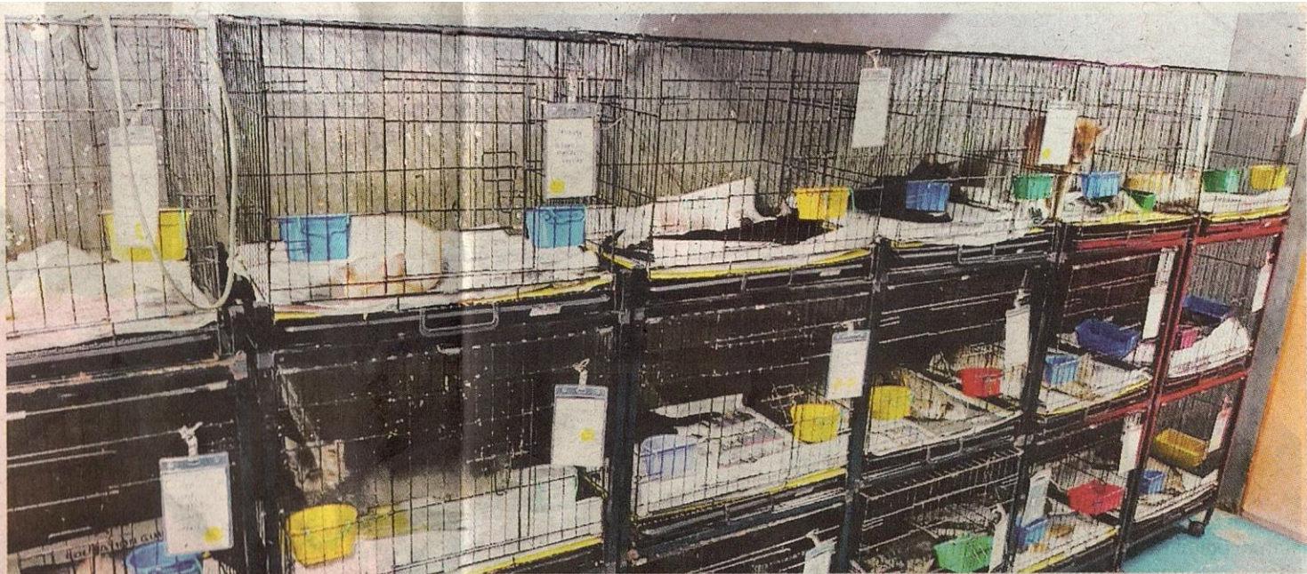
KUCING-KUCING jalanan yang menghidap pelbagai penyakit dan dijangkiti virus diletakkan di dalam sangkar untuk diberi tumpuan rapi.