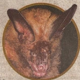
Kelawar Muka Lekuk

ai kelawar ekor elinga yang tebal, epan g lengan sekitar rat boleh g