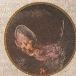
Kelawar Jari Panjang