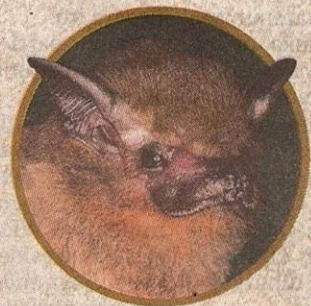
Kelawar Teng Teng Besar