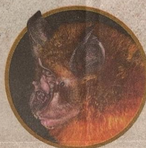
Kelawar Ladang Kenarong