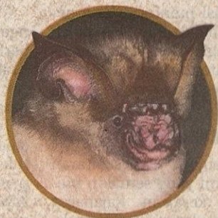
Kelawar Ladang Bulat Asia