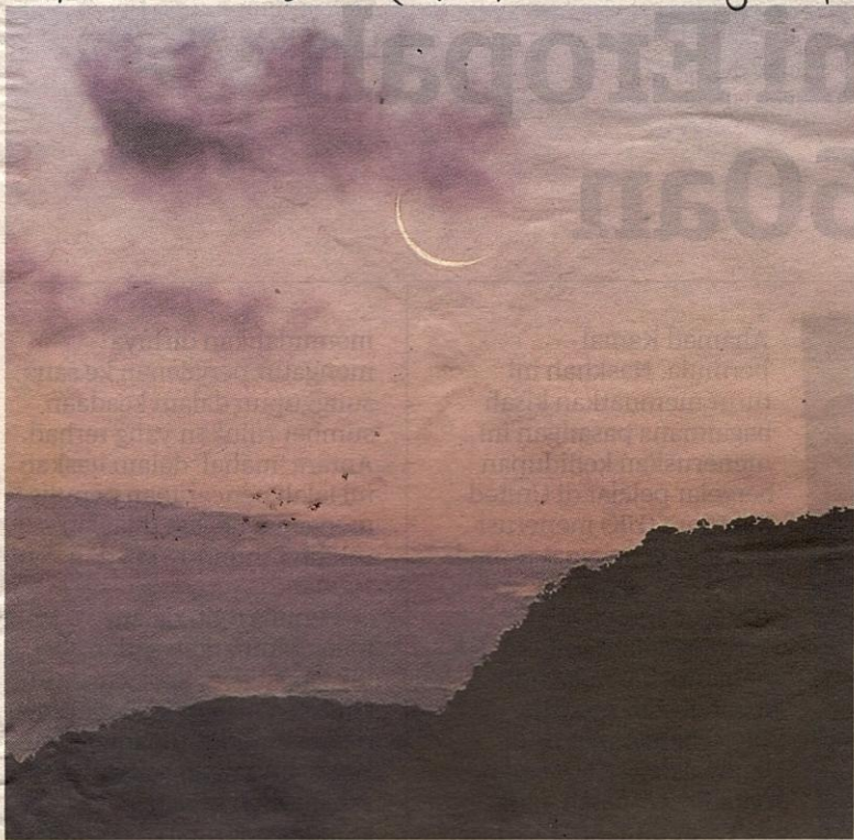
HILAL (anak bulan) sebagai panduan dan bimbingan masyarakat Islam.