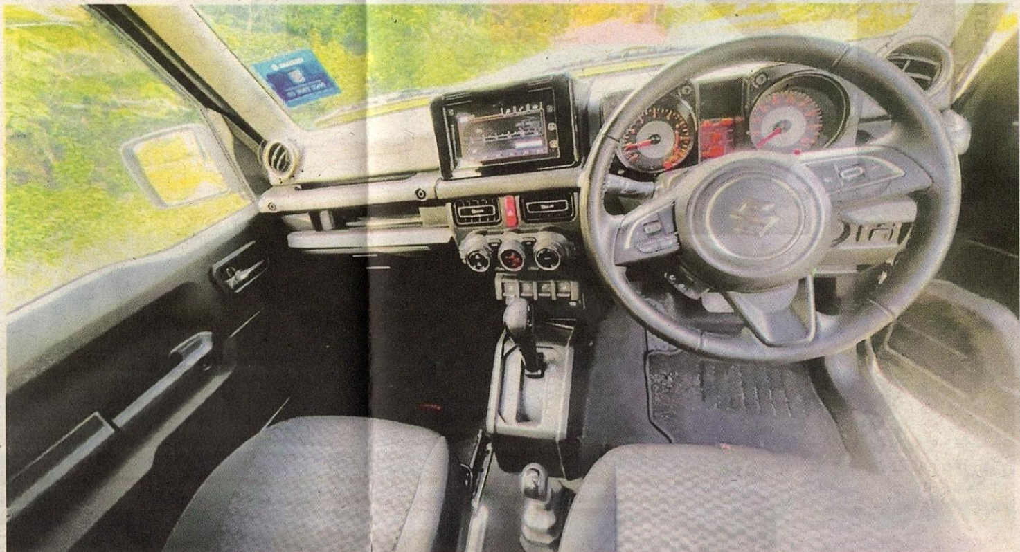
TOMBOL gear 'tradisional' terletak pada konsol tengah antara pemandu dan penumpang hadapan.

September tahun lalu, Suzuki yang kini di bawah Naza Eastern Motors Sdn. Bhd. telah melancarkan generasi keempat Jimny dengan hanya menawarkan varian tunggal.