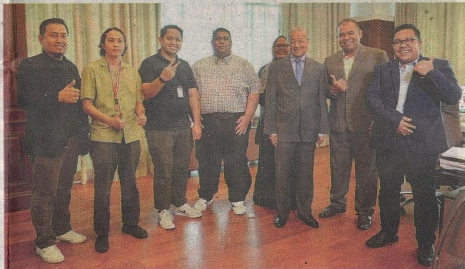
Kru Sinar Harian bergambar bersama Dr Mahathir selepas sesi wawancara eksklusif itu.