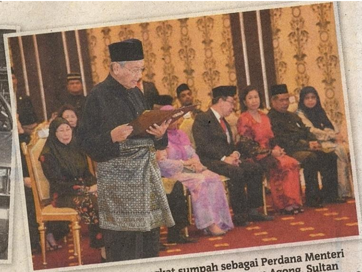
Dr Mahathir mengangkat sumpah sebagai Perdana Menteri Malaysia ke-7 di hadapan Yang di Pertuan Agong, Sultan Muhammad V di Balai Rong Seri, Istana Negara pada 10 Mei 2018

Pada masa sama, beliau juga menggalakkan lebih ramai anak muda