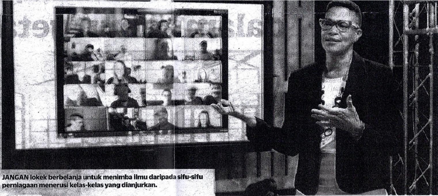
JANGAN lokek berbelanja untuk menimba ilmu daripada sifu-sifu perniagaan menerusi kelas-kelas yang dianjurkan.

Minggu ini Horizon kongsi tip bagaimana untuk berjaya dalam perniagaan online.