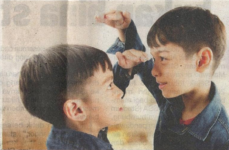
Bantut merupakan kegagalan tumbesaran biasa kepada kanak-kanak kecil disebabkan pemakanan dan jangkitan yang lemah.

bantut adalah dua faktor yang boleh menjejaskan perkembangan minda kanak-kanak termasuk fungsi kognitif.