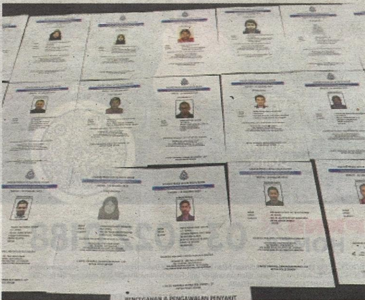
Suspek dan pembeli sijil vaksin yang telah dikenal pasti Polis Johor.

“Kes disiasat di bawah Seksyen 420 dan Seksyen 511 Kanun Keseksaan serta Seksyen 22 (d) Akta Pencegahan dan Kawalan Penyakit Berjangkit 1988,” tambahnya.