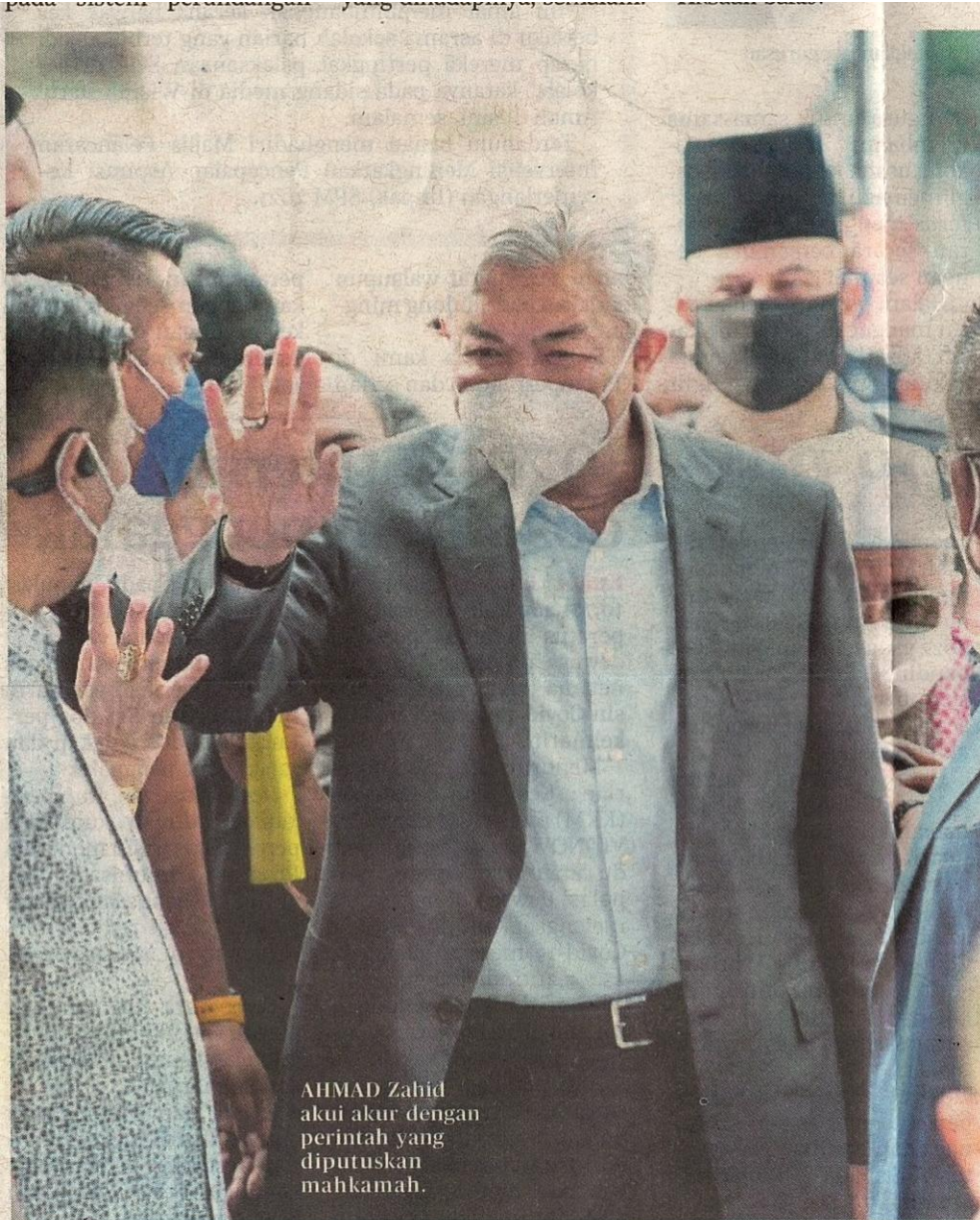
AHMAD Zahid akui akur dengan perintah yang diputuskan mahkamah.

Perdana Menteri Datuk Seri Najib Tun Razak , yang berdepan 25 pertuduhan rasuah dan perubahan wang haram membabitkan dana 1Malaysia Development Berhad (1MDB) berjumlah RM2.28 bilion , yang dijadual bermula dari 19 Ogos hingga dua minggu pertama November 2019.