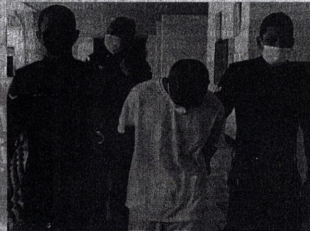
REMAJA yang diperintah menjalani pemulihan di Sekolah Henry Gurney atas kesalahan amang seksual.

Lin pernah memenangi pingat gangsa dalam acara berpasukan pada Sukan Asia 2006.