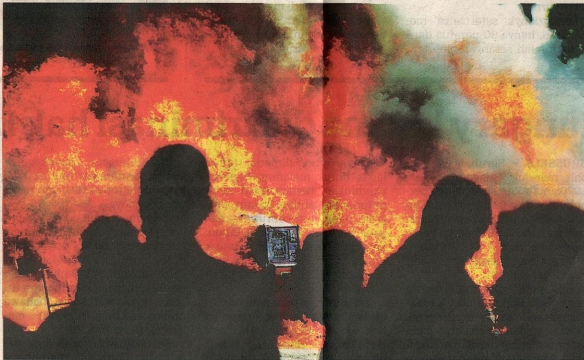
PIHAK berkuasa membakar rampasan dadah sebanyak satu tan di negeri Jalisco pada 14 Julai lalu.

Dia dituduh menjadi pengasas bersama kartel dadah Guadalajara yang sudah berkubur dan