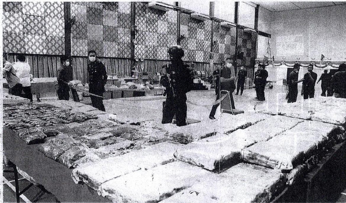
SEBAHAGIAN dadah yang dirampas dalam serbuan ke atas dua buah stor dan makmal memproses bahan terlarang itu di Johor pada Januari tahun lalu.

rana dua negeri itu mempunyai pelabuhan terbesar yang menjadi transit keluar masuk barangan dari dalam dan luar negara sekali gus memberi peluang kepada sindiket untuk menyeludup dadah dalam kuantiti besar dengan menggunakan kontena.