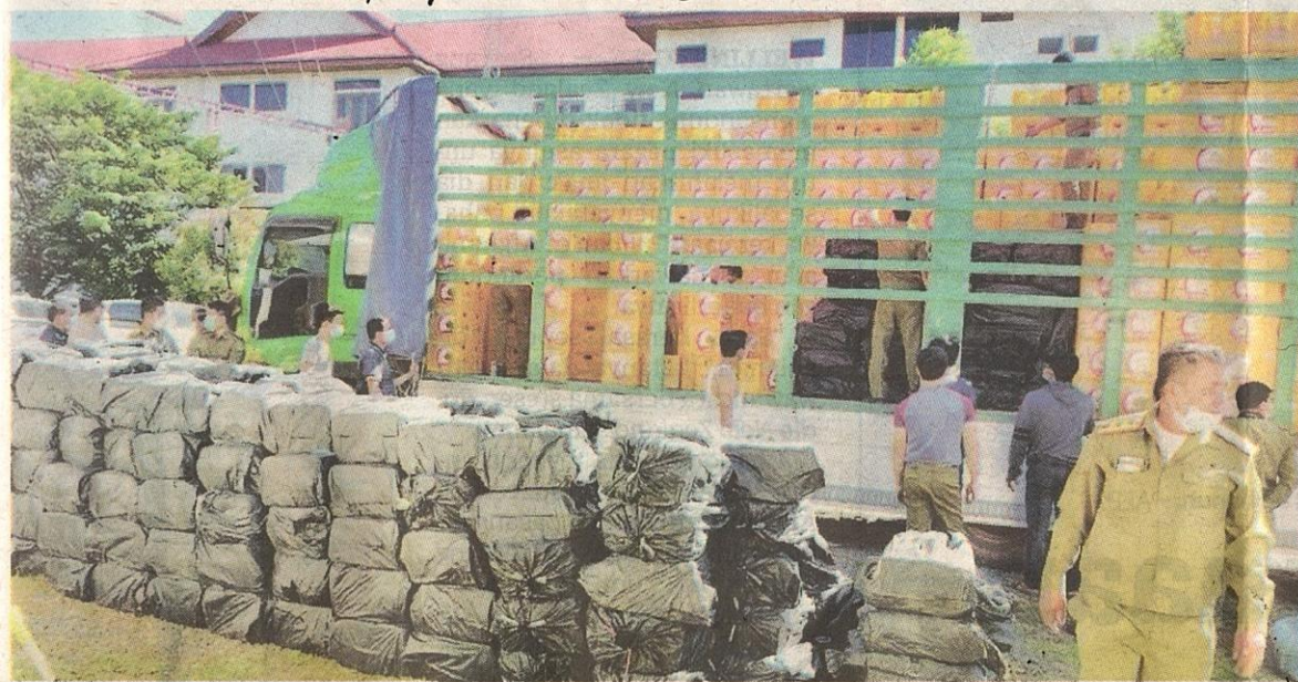
ANTARA bungkusan mengandungi 55 juta pil methamphetamine yang dirampas pada Oktober 2021.