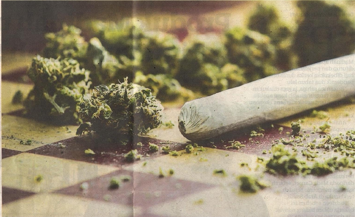
PENGAMBILAN ganja boleh menyebabkan perkembangan otak terbantut, selain mengganggu proses membuat keputusan. – GAMBAR HIASAN

Di sini saya akan merungkai mengenai kesan sampingan pengambilan ganja