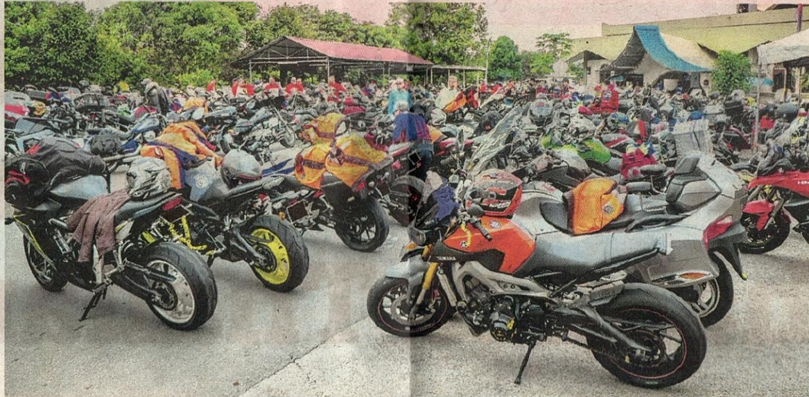
ORANG muda sedang merancang untuk berkonvoi ke Thailand dengan menunggang motosikal bagi menghisap ganja asli. – GAMBAR HIASAN

ke sana sejak Thailand mengeluarkan ganja daripada senarai dadahnya. Ramai kawan yang sudah pergi ke Amsterdam atau Kanada memberitahu menghisap ganja asli lebih seronok berbanding yang mampat dan perlu dicuba,” katanya.