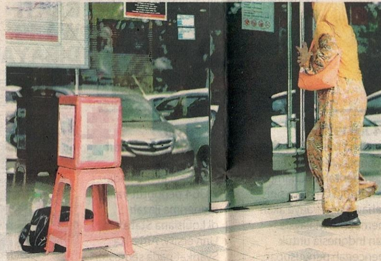
ADA pihak mempergunakan institusi tahfiz bagi tujuan mengutip derma pembinaan bangunan yang tidak wujud. - GAMBAR HIASAN

Beliau berkata, tanpa pengiktirafan kerajaan atau sokongan daripada persatuan, masa depan penuntut juga seolah-olah diperjudikan kerana anak-anak tahfiz yang belajar di situ bakal