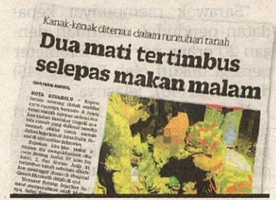
KERATAN Kosmo! semalam.