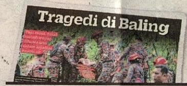
KERATAN Kosmo! 6 Julai 2022.

lui situasi yang menakutkan ini. Kami rayu pihak berkaitan untuk melakukan sesuatu," jelasnya.