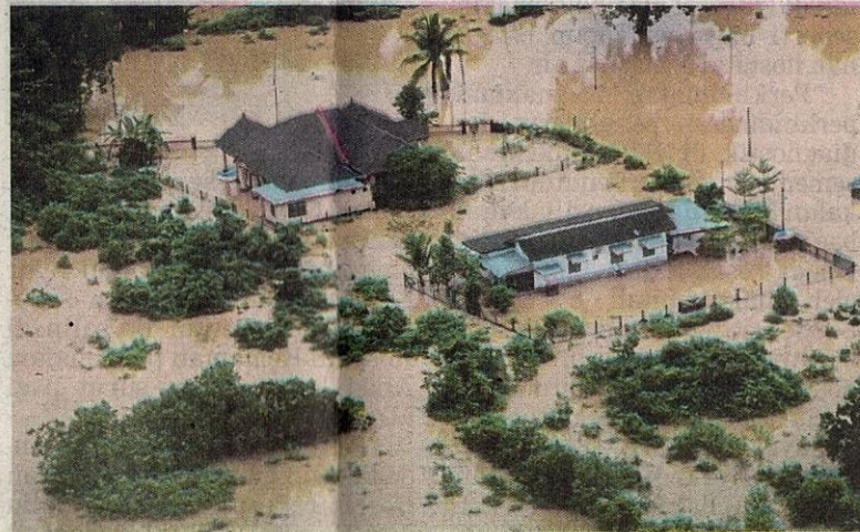
Beberapa kawasan di Terengganu dilanda banjir, semalam.

Setakat jam 7 malam semalam, seramai lebih 71,000 mangsa banjir masih berlindung di PPS di lima negeri, dengan Terengganu dan Kelantan terus merekodkan peningkatan mangsa, masing-masing 39,108 orang daripada 10,735 keluarga dan 26,630