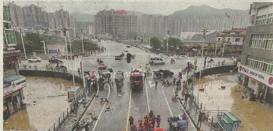
Kebanyakan kawasan di dataran rendah ditenggelami banjir susulan paras air melimpah di kebanyakan sungai utama.