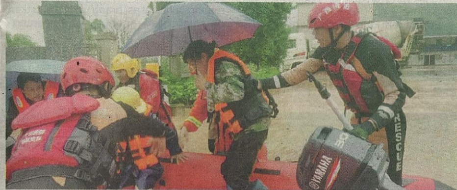
Penduduk dipindahkan ke pusat penempatan sementara di bandar Shaoguan.