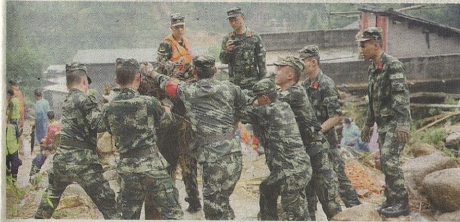
Pasukan penyelamat dikerah untuk membantu penduduk di kawasan terjejas banjir.