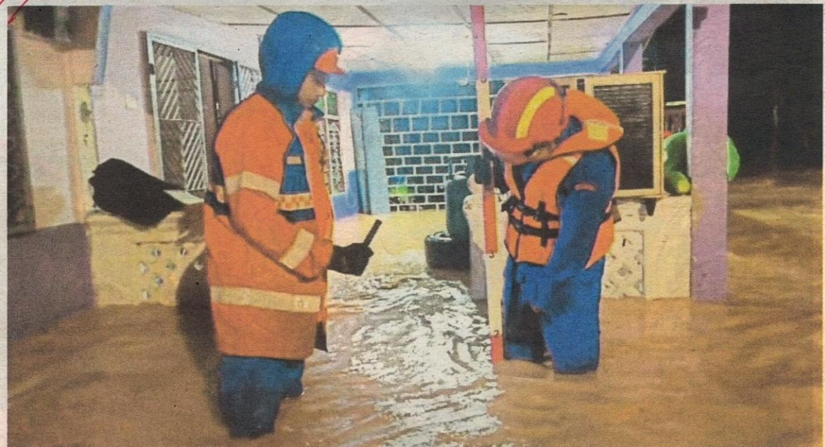
Kedaaan banjir di Mukim Sok selepas hujan lebat menyebabkan air Hulu Sungai Lentang dan Hulu Sungai Sok melimpah..