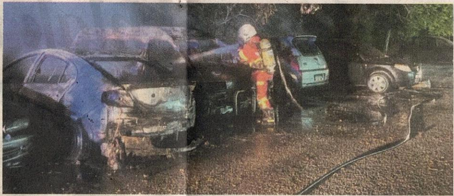
ANGGOTA bomba memadamkan kebakaran lapan kenderaan diletakkan di hadapan sebuah bengkel di Jalan Nova U5/94A, Laman Permai, Sungai Buloh.

Katanya, anggota bertugas melakukan pemadaman menggunakan hos sebelum api dikawal sepenuhnya dan tiada mangsa dilaporkan cedera dalam kejadian itu.