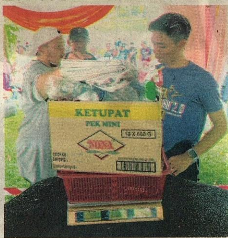
PESERTA membawa barangan kitar semula yang telah diasingkan mengikut kategori.

Ketabahan para peserta menantikan umpan dimakan ikan amat dipuji kerana boleh memupuk sifat sabar dalam diri yang semestinya menjadi sebahagian