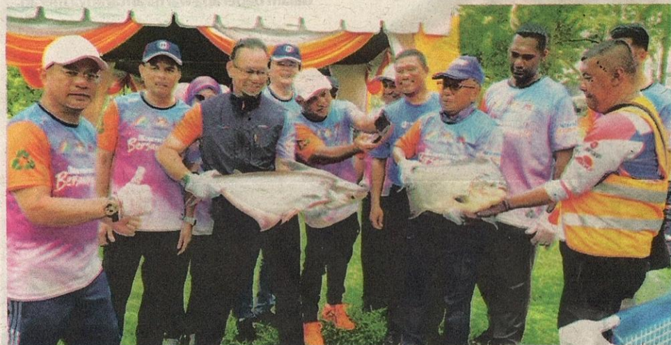
ANTARA ikan besar yang berjaya dipancing para peserta pada pertandingan yang bermula dari pukul 8.30 pagi hingga 12.30 tengah hari itu.

Suasana tenang tiba-tiba menjadi riuh selepas beberapa pemancing berjaya menaikkan ikan yang kemudian