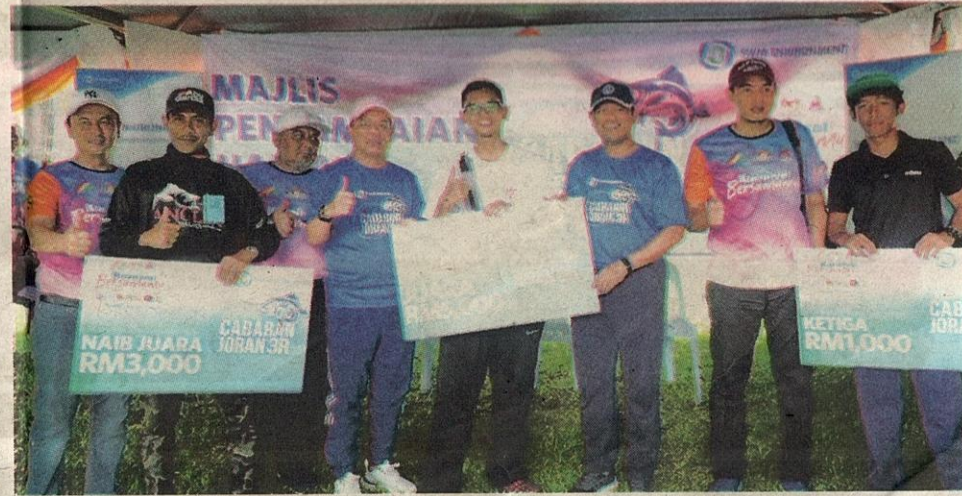
WAJAH-WAJAH ceria para pemenang yang berjaya pulang dengan hadiah wang tunai masing-masing pada pertandingan tersebut.

“Saya tidak menunggu masa lama dan dalam tempoh 10 minit berjaya menaikkan patin. Tidak sangka pula ikan yang dipancing itu paling berat dalam pertandingan ini,” katanya.