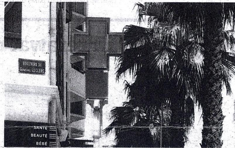
PAPAN tanda elektronik menunjukkan suhu mencecah 40 darjah Celsius di Hendaye, selatan Perancis pada 18 Jun lalu.

Beratus-ratus anggota bomba turut dikerah ke barat Slovenia Rabu lalu untuk memadamkan api yang memaksa sebilangan perkampungan dikosongkan, kata perkhid-