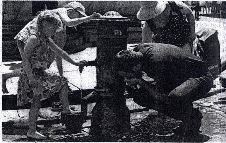
ORANG ramai minum air daripada pili awam di Rom ketika gelombang haba berlaku di Eropah pada 19 Julai lalu.

“Bahang panas terasa di belakang kami. Kami bernasib baik ke-