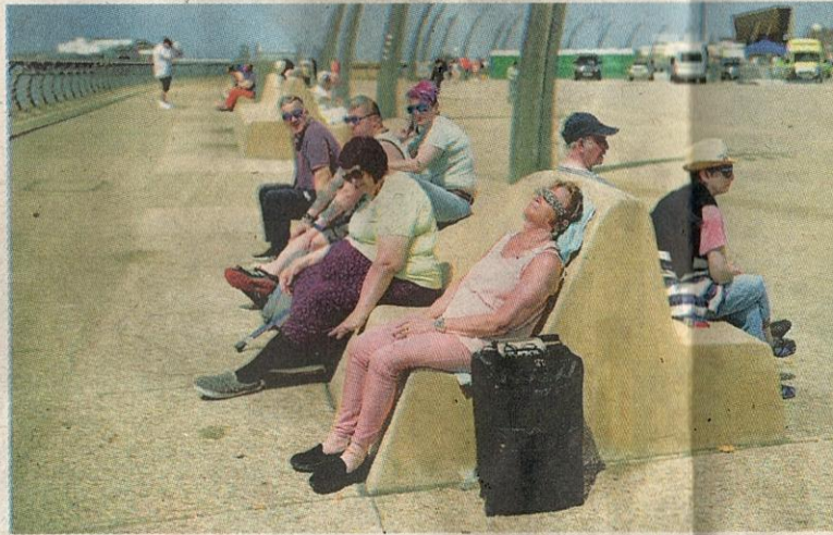
ORANG ramai berehat di sebuah persiaran di Blackpool, England pada 17 Julai lalu.

Merdeka yang ingkar berdepan denda sehingga £1,000 (RM5,378).