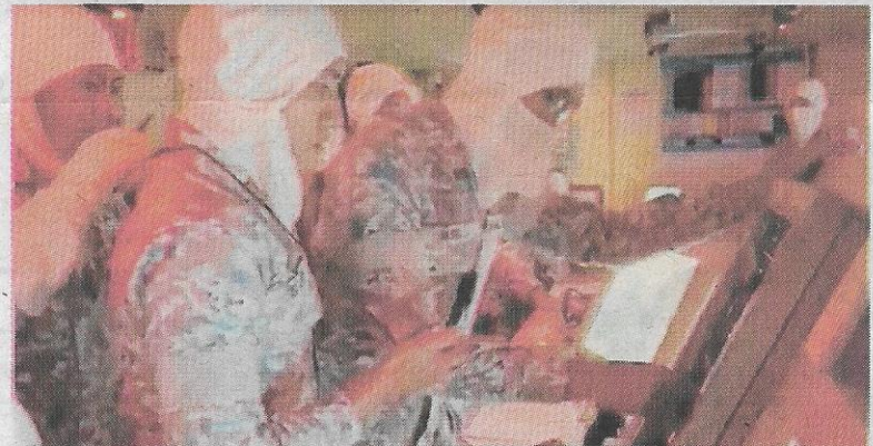
Penyertaan dalam Eksekais Rim of the Pacific (RIMPAC) 2022 tambah profesionalisme kru KD Lekir .