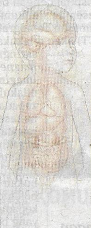
Kanser di kelenjar adrenal