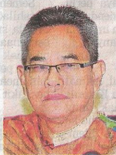
Dr Zainal Ariffin Omar

Laman COVIDNOW melaporkan selepas tiga bulan, Malaysia kembali merekodkan pertambahan kes baharu lebih 5,000 iaitu 5,230 setakat kelmarin.