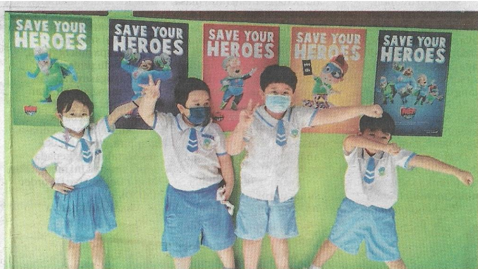
KANAK-kanak teruja menyertai kempen FAST Heroes.

yang diserang penyakit ini. “Saya percaya program ini bukan setakat dapat memberi pendedahan kepada kanak-kanak, malah mampu menyelamatkan lebih banyak nyawa,” katanya dalam Majlis Pelancaran Kempen FAST Heroes baru-baru ini.