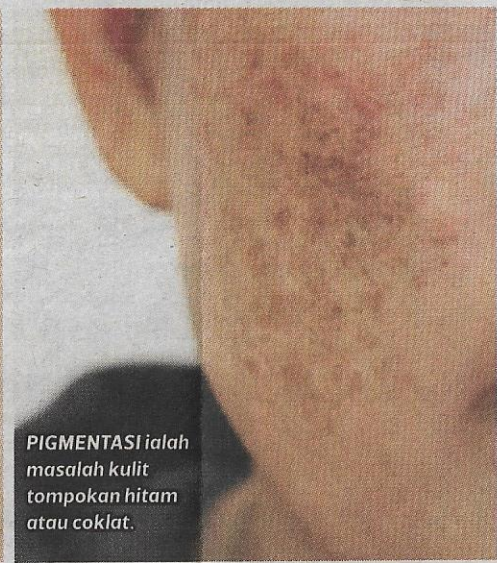
PIGMENTASI ialah masalah kulit tompokan hitam atau coklat.