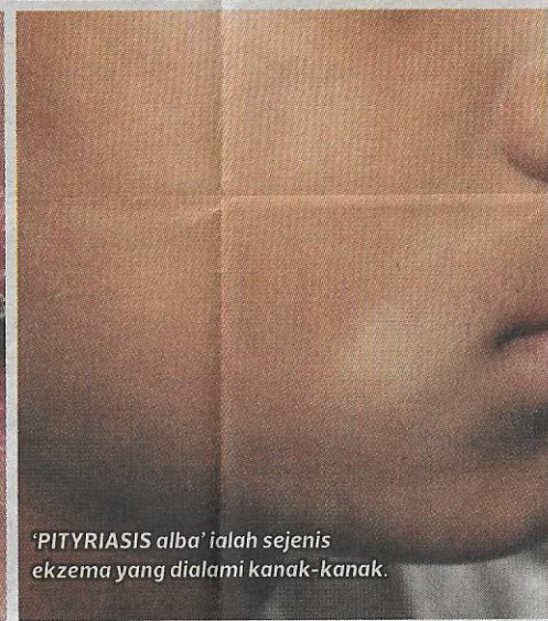
'PITYRIASIS alba' ialah sejenis ekzema yang dialami kanak-kanak.