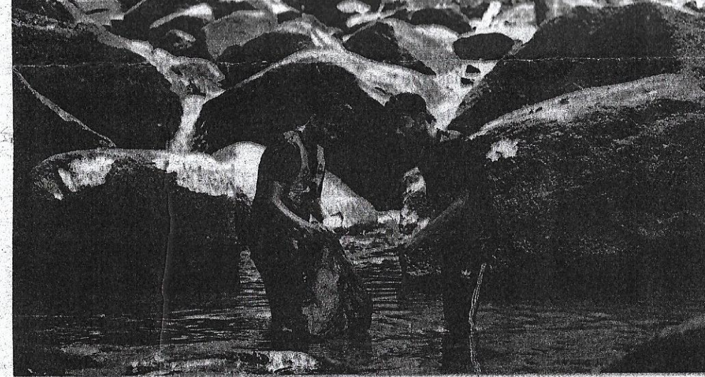
AIR terjun antara lokasi kerap dikaitkan dengan kencing tikus.

Pastikan pengambilan air sudah dimasak atau sumber yang diyakini bersih