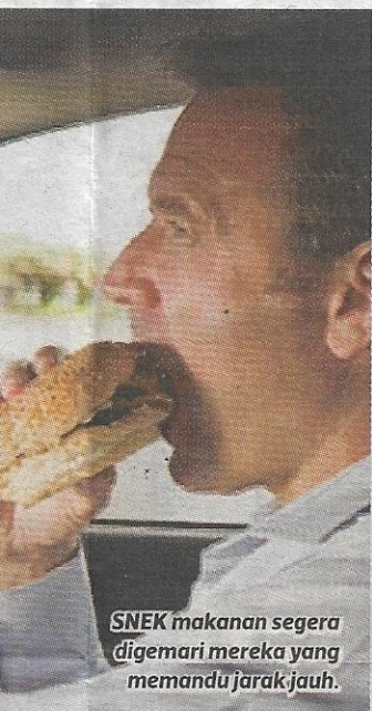
SNEK makanan segera digemari mereka yang memandu jarak jauh.