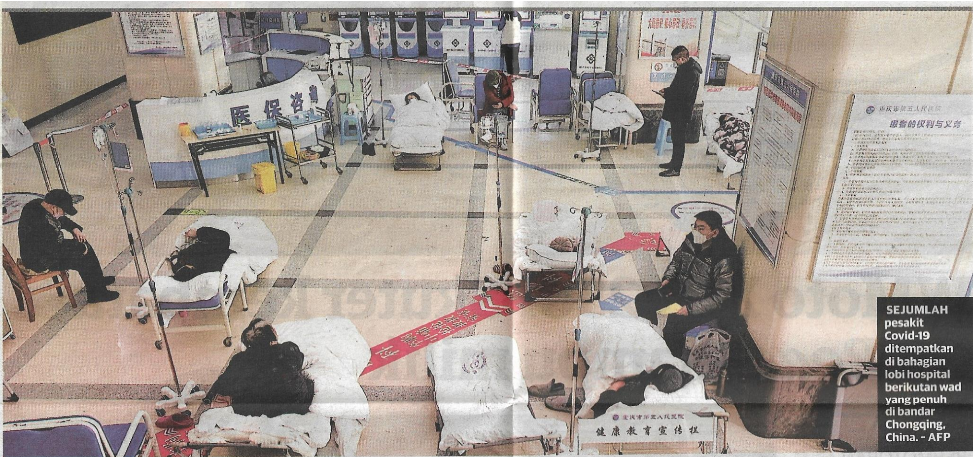
SEJUMLAH pesakit Covid-19 ditempatkan di bahagian lobi hospital berikutan wad yang penuh di bandar Chongqing, China.