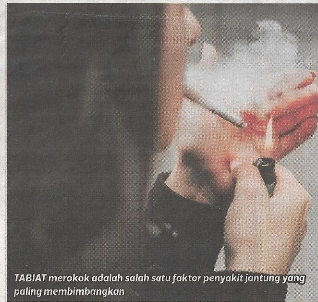
TABIAT merokok adalah salah satu faktor penyakit jantung yang paling membimbangkan

penyakit jantung atau menambah baik keadaan pesakit yang mempunyai penyakit jantung sedia ada selain mengurangkan risiko komorbiditi lain