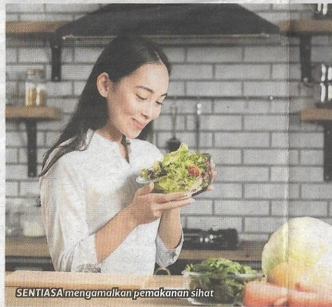
SENTIASA mengamalkan pemakanan sihat