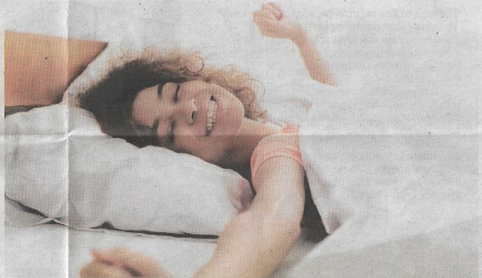
PERUBAHAN hidup termasuk melakukan senaman dengan kerap, menguruskan tekanan dengan baik dan mendapatkan tidur yang mencukupi dapat membantu mengelakkan sakit kepala berepisod menjadi migrain kronik.