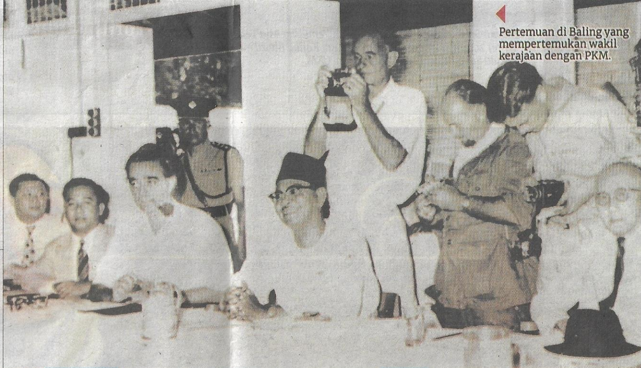
Pertemuan di Baling yang mempertemukan wakil kerajaan dengan PKM.