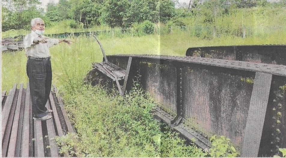
MOKHTAR menunjukkan antara struktur turn table yang pernah digunakannya dahulu untuk memusingkan kepala kereta api mengikut destinasi.

“Dengan menggunakan turn table (meja pusingan lokomotif), kepala kereta api akan dipusingkan mengikut destinasi. Jika kereta api dari Kuala Lumpur nak ke Johor tidak perlu dipusingkan