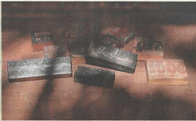
ANTARA blok cetakan yang masih dijaga rapi.

bagaimanapun terpaksa menamatkan operasi pada 2010.