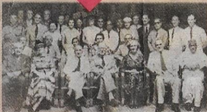
Ahli-ahli Suruhanjaya Reid.