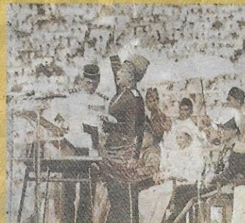
Tunku Abdul Rahman melaungkan 'Merdeka' pada pagi 31 Ogos 1957 di Stadium Merdeka, Kuala Lumpur.

PAGI 31 Ogos 1957, bertempat di Stadium Merdeka, Kuala Lumpur, upacara sambutan kemerdekaan diadakan dengan penuh gemilang. Pengisytiharan itu disambut dengan laungan 'Merdeka' sebanyak tujuh kali oleh Tunku Abdul Rahman sebagai Perdana Menteri Persekutuan Tanah Melayu yang pertama. Bendera Persekutuan Tanah Melayu telah dinaikkan dengan iringan lagu kebangsaan, Negaraku.