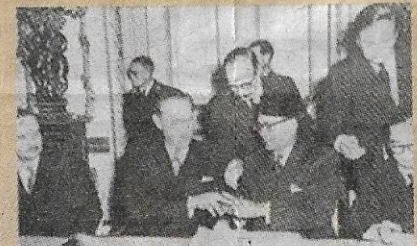
Perjanjian Kemerdekaan Tanah Melayu yang juga dikenali sebagai Perjanjian London telah ditandatangani pada 8 Februari 1956.

MISI rundingan ini berjaya mendapat persetujuan kerajaan British untuk memberikan kemerdekaan kepada Tanah Melayu melalui perjanjian yang dikenali sebagai Perjanjian Kemerdekaan Tanah Melayu atau Perjanjian London yang telah ditandatangani pada 8 Februari 1956. Antara perkara penting yang dipersetujui di dalam