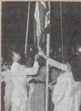
Bendera Union Jack diturunkan.