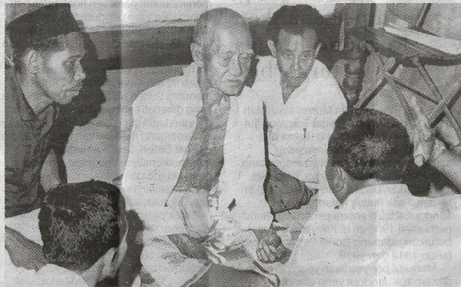
Mat Kilau (tengah) dikelilingi mereka yang ingin melihat sendiri dan mendengar sejarah hidup beliau.

M at Kilau, sebaris nama yang cukup sinonim kerana keberaniannya menentang penjajah British di Pahang.