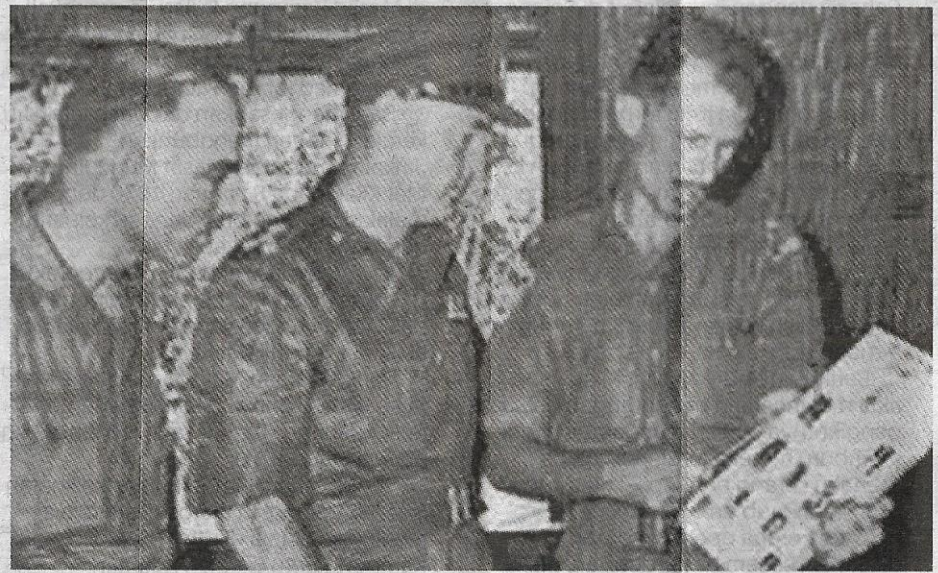
Gambar dipercayai askar Singapura yang dihantar untuk bertempur dengan Tok Janggut dan pengikutnya.

Mayat beliau telah digantung songsang dan diarak sekeliling bandar Kota Bharu sebelum dikebumikan di Seberang Sungai, Pasir Pekan.