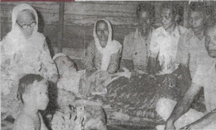
Gambar ini dikatakan Tok Guru Peramu yang sedang sakit yang diziarahi saudara mara. Tok Guru Peramu dipercayai ialah Datuk Bahaman.

Mengimbab kembali sejarah mereka, Sultan Ahmad cukup berterima kasih kepada Datuk Bahaman kerana membantu baginda menewaskan kekadanya, Bendahara Wan Mutahir dalam perang saudara yang berlaku pada tahun 1857 hingga 1863.